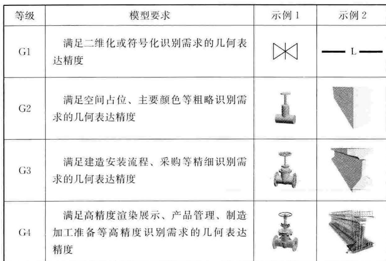
表 1 几何表达精度四个等级示例

4.1.6 几何表达精度等级与设计阶段不存在一一对应关系，而是根据设计阶段或应用需求选取。在项目中，可以为不同的模型单元选取不同等级的几何表达精度。例如某项目的施工图阶段，现浇钢筋混凝土楼梯段选取 G4，以便保障准确施工，而同时楼梯栏杆选取 G3，使采购人员能够掌握设计要求而顺利选择生产厂家的成品。