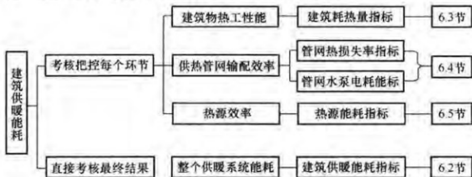
图3 建筑供暖能耗相关指标框架图

6.1.2 建筑供暖能耗不仅与建筑本体的热工性能相关，还与建筑内人的使用行为模式、热力管网系统运行调节状况、输配管网效率以及热源设备效率密切相关。因此本标准要求，对于建筑供暖系统能耗的考核与管理，除应考核建筑供暖系统综合性指标——建筑供暖能耗指标以外，还应考核建筑耗热量指标、管网热损失率指标、管网水泵电耗指标和热源热量转换效率指标等，用以评价建筑供暖终端用能、能源输配效率和能源转换效率等性能。建筑供暖能耗相关指标的框架见图3所示：